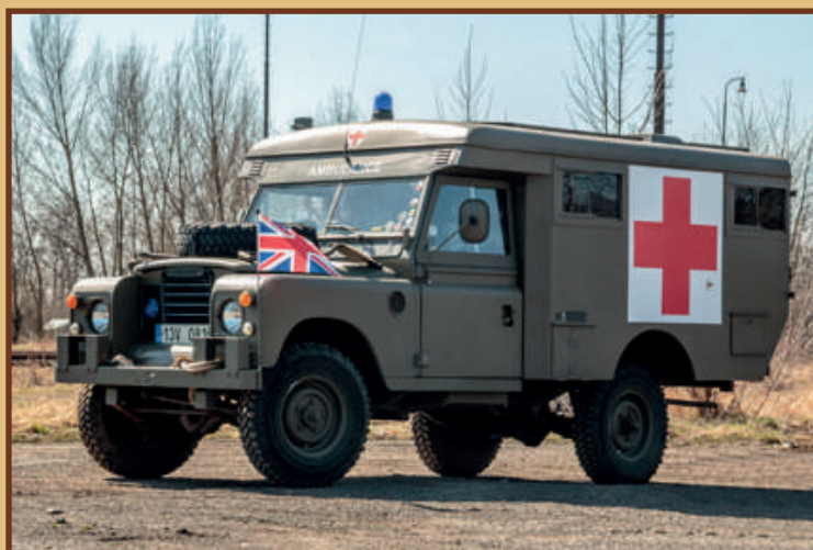
Army provedení - sanitní vůz